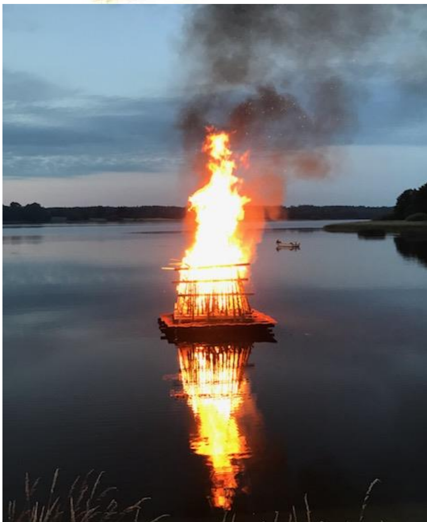
Sidste års bål på søen.