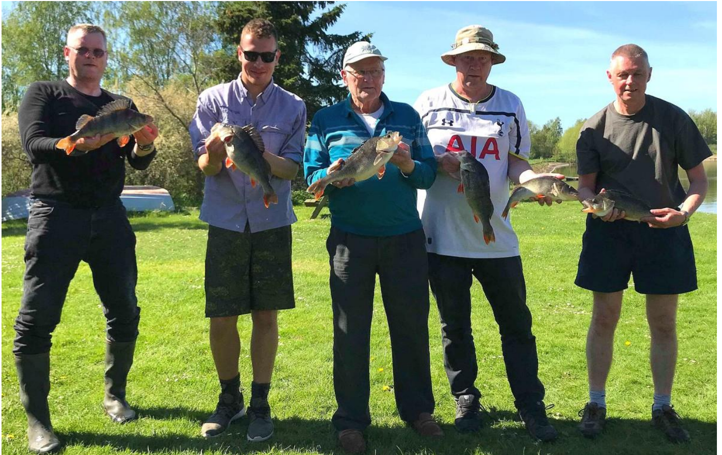
En del af de flotte aborrer på præmiedagen d. 6. maj.

Udover fangsterne her var der en håndfuld aborre mere over kiloet, så der var gang i aborrerne på dagen.