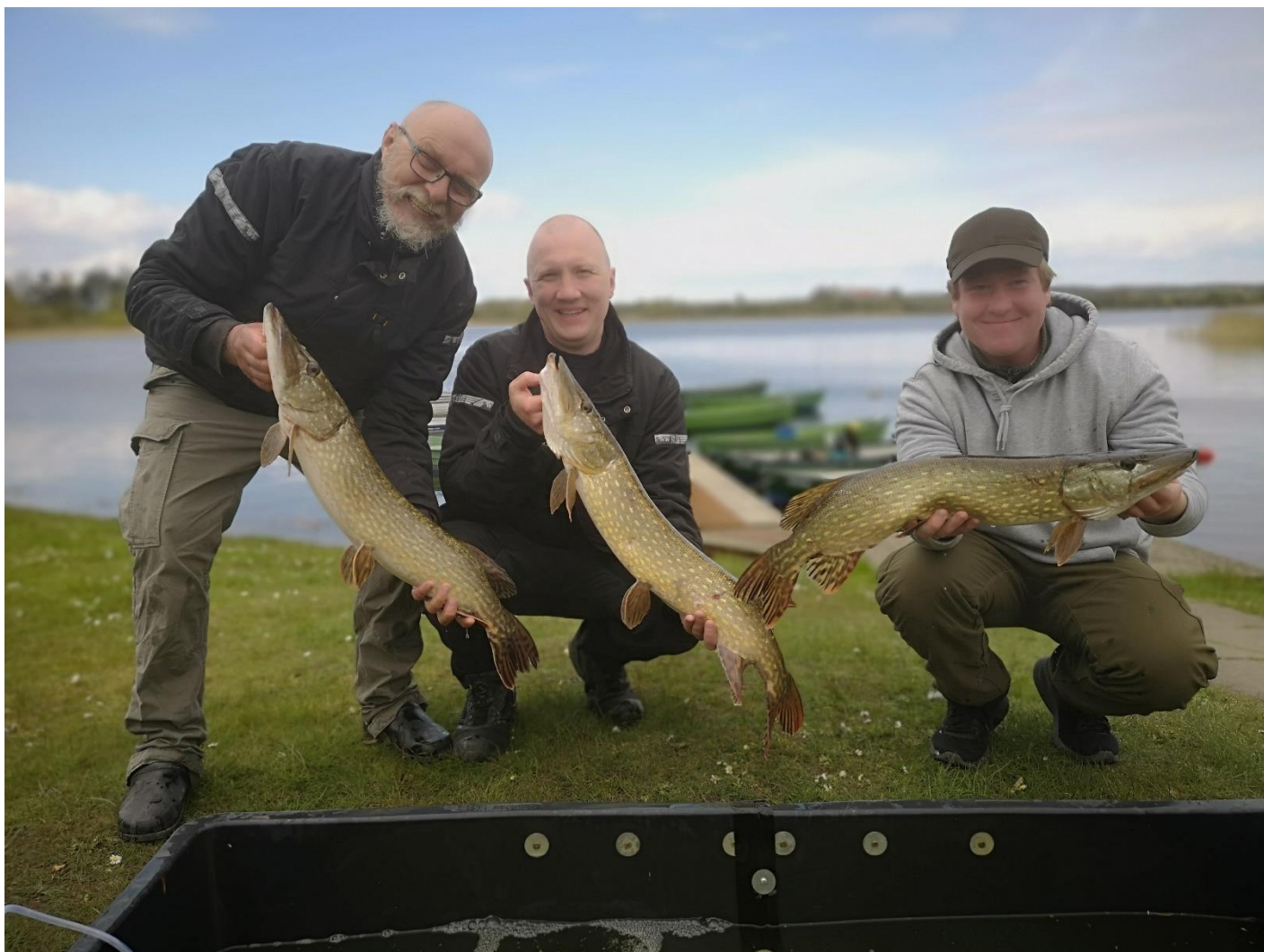
De tre præmiefisk, og deres fangere.

I Gyrstinge Sø havde et medlem dog en LF-gæst med, og han fangede dog en gedde på 7,9 kg søndag.